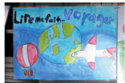
Des dessins et des citations d'enfants autour de la lecture