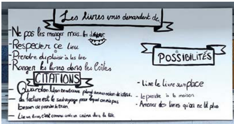
Les consignes d'utilisation de la boîte à livres

entre en scène, en indiquant le chemin vers l'une des classes, dans l'un des recoins de l'école.