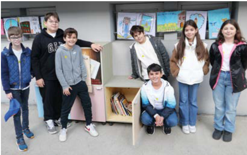
Les élèves ont guidé les invités dans les classes.