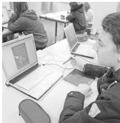
Les étudiants ont réalisé leur affiche avec une tablette graphique.

Certains relèvent toutefois l'importance de l'initiative, car «c'est une bonne idée de demander aux jeunes de s'adresser aux jeunes pour faire passer le message de l'importance de la politique.» Plusieurs trouvent du reste que leurs affiches réalisées dans cette classe sont différentes de celles que l'on peut voir dans la rue. Un étudiant estime cependant qu'il serait judicieux d'élargir le public cible, sachant qu'il n'y a pas seulement les jeunes qui ne s'impliquent pas suffisamment dans la vie civique. A ses yeux, une approche plus large des destinataires aurait ouvert à davantage de possibilités créatives.